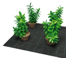
Laminas de agricultura, sombrea y anti-hierba

Sacos y bolsas de basura, gran variedad de tamaños y modelos.