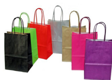
Bolsas de Papel

Efecto glacial, gran resistencia, asas reforzadas, fuelle de fondo. 100% personalizable.