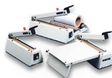
Soldadoras para Bolsas

Sacos Rafia tubulares y con boca doblada y ribeteada. 100% personalizables.