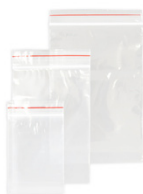
Bolsas de Cierre Hermético

Todo tipo de modelos, acabados, colores. 100% personalizables.