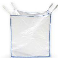
Sacos Big-Bag de Carga y Descarga

Diversas aplicaciones en agricultura, viverismo, jardinería y uso domestico.