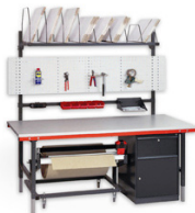
Centro de Empaquetado

Corta y desgarras en un mismo dispensador modular. 100% compatible con los sistemas de trabajo modulares.