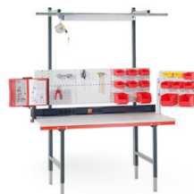
Estación de Trabajo Universal

Mesas y estaciones de empaquetado totalmente adaptadas a sus necesidades.