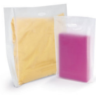
Bolsas Efecto Glacial

Diferentes tamaños, medidas, espesores, en rollo o en block. 100% personalizables.