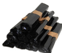
Sacos y Bolsas de Basura

Bolsa o sobre adhesivo para el envío de documentos junto con la mercancía.