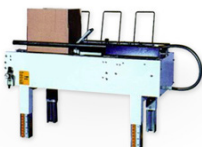
Formadora de Cajas

Máquina para doblar las cuatro solapas inferiores.